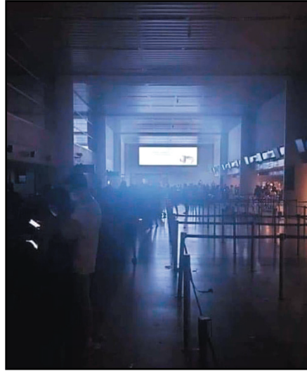
مطار بيروت عشية يوم ١٧/٨/٢٠٢٤

اخيراً، ومع كل الاحترام لقواعد التيار السياسي الذي يتحكم بالطاقة نقول: اضغطوا على رفاقكم وواجهوهم بالنصيحة وما يقوله الشعب اللبناني فيهم، اللهم إلا إذا كنتم وایاهم مخلوقات فضائية اصابها العمى فلا ترى سوى مصالحها وحسب وقد طفح الكيل.